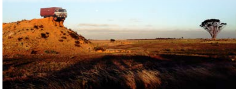
荒野中的裝置藝術 Installation Art in the middle of nowhere

每年有近三萬名台灣年輕人在澳洲打工度假，適應完全不同的語言、文化和工作環境，年輕朋友們眼中的澳洲是何種風貌？透過精選的 34 張攝影作品完整呈現。青年背包客們藉由「打工度假計畫」勇於突破、追尋自我、思考未來、珍惜友誼與體會生命的意涵。也藉此更深刻體認對土地對自然萬物的尊重；尤其是徜徉在遼闊天地與自然之美時，所生敬畏和感動！